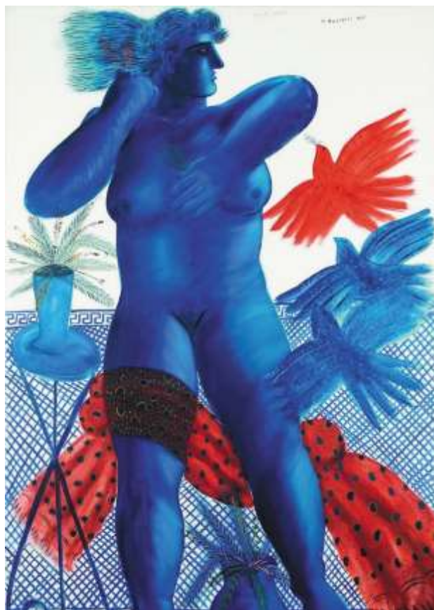
Έργο του Αλέκου Φασιανού από την περίοδο του Παρισιού.